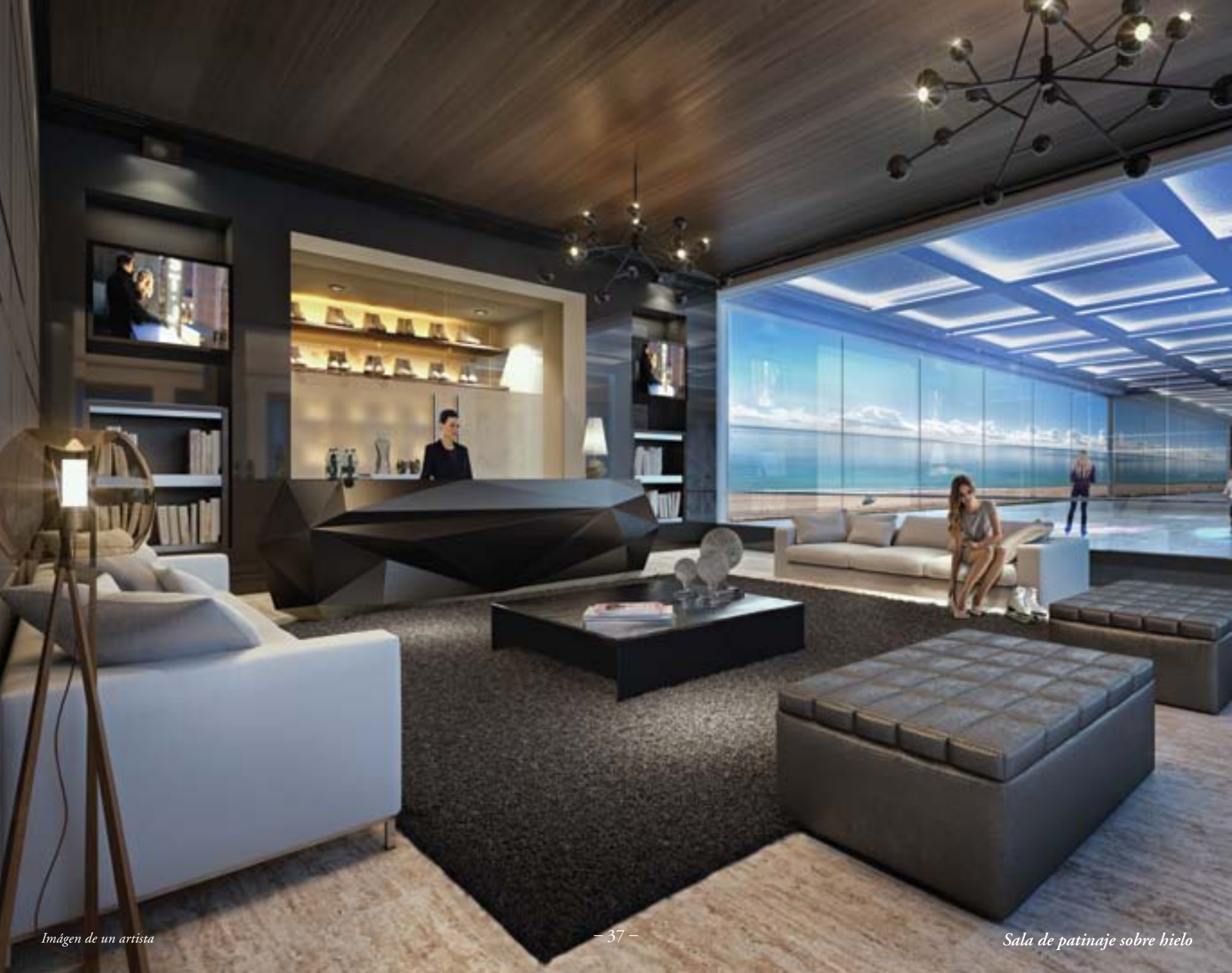
Imágen de un artista