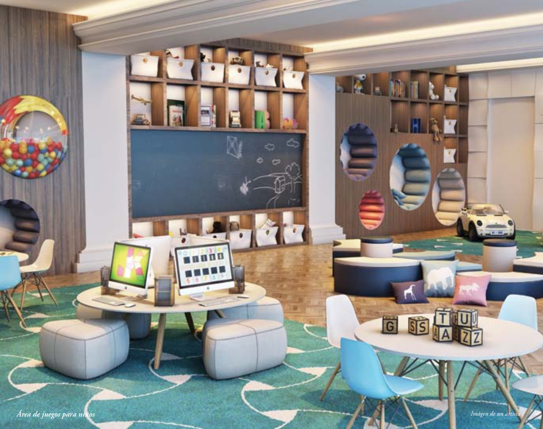
Área de juegos para niños