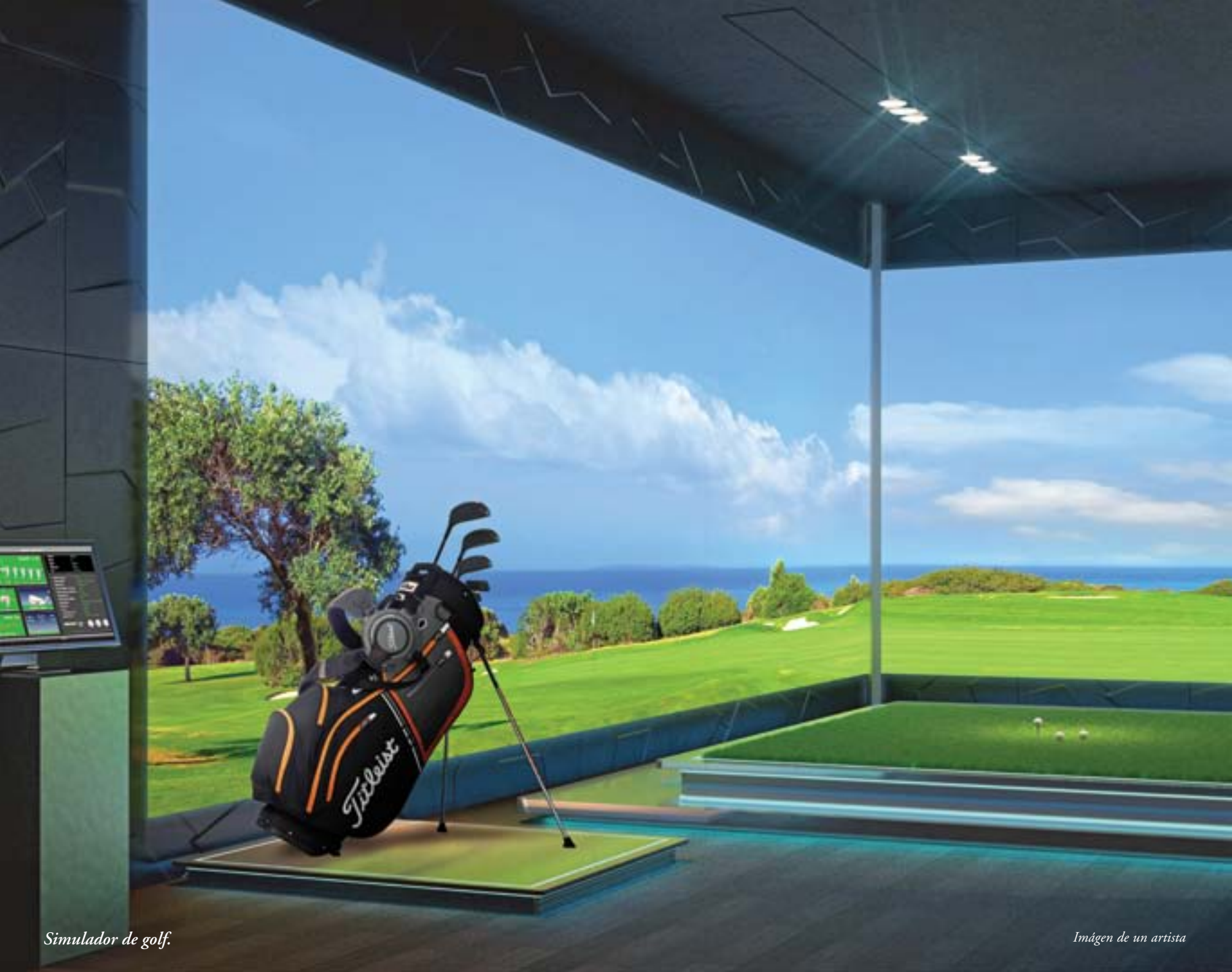
Simulador de golf.