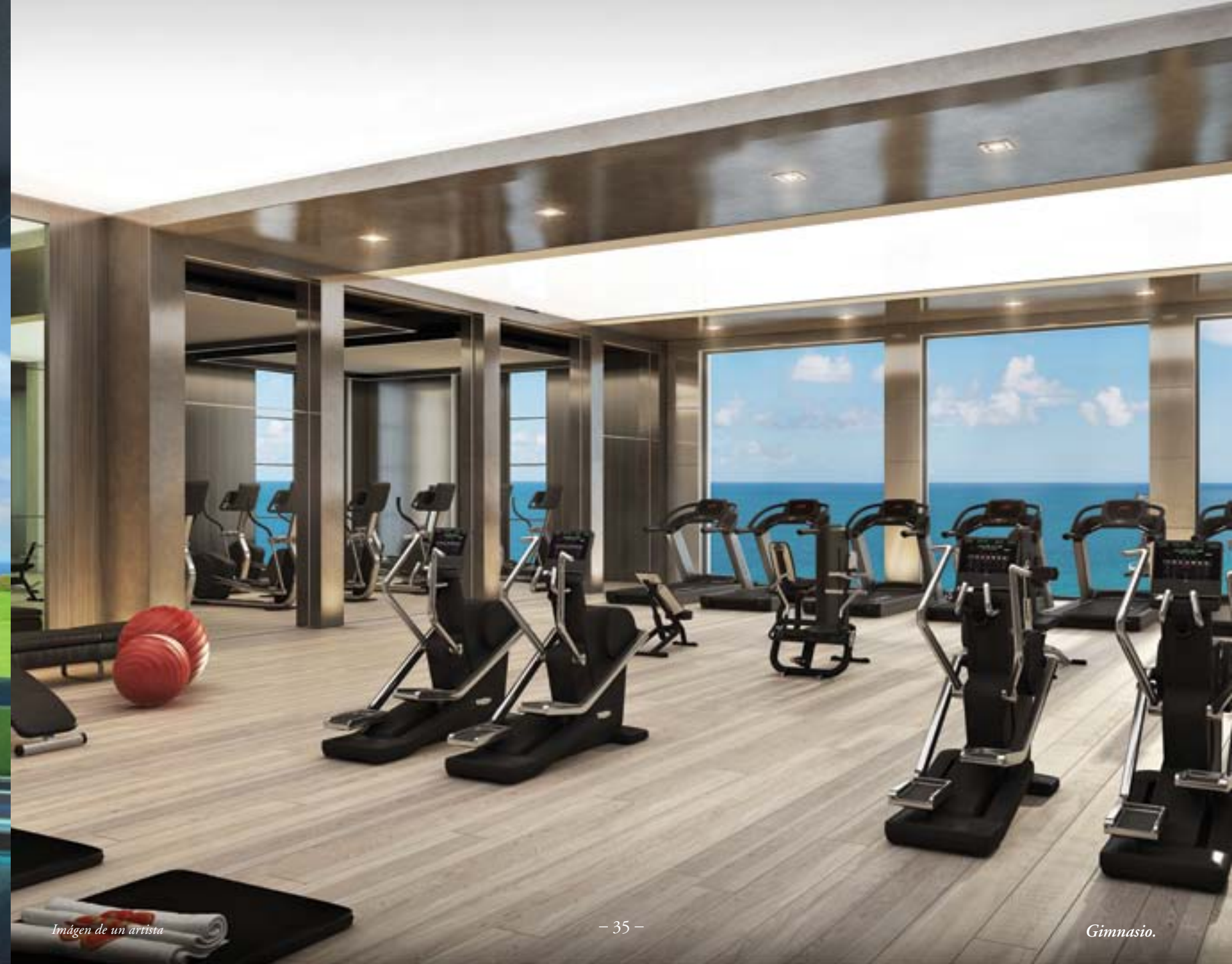
Imágen de un artista