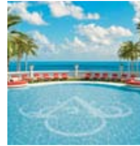
Imagen de un artista

Circus Maximus. Fue uno de los espacios públicos más grandes e importantes de la antigua Roma que aún permanecen hasta nuestros días. Su ambiente de celebración ha sido recapturado y reimaginado dentro del edificio único con 45,000 pies cuadrados repletos de comodidades que llamamos Villa Acqualina: un piso