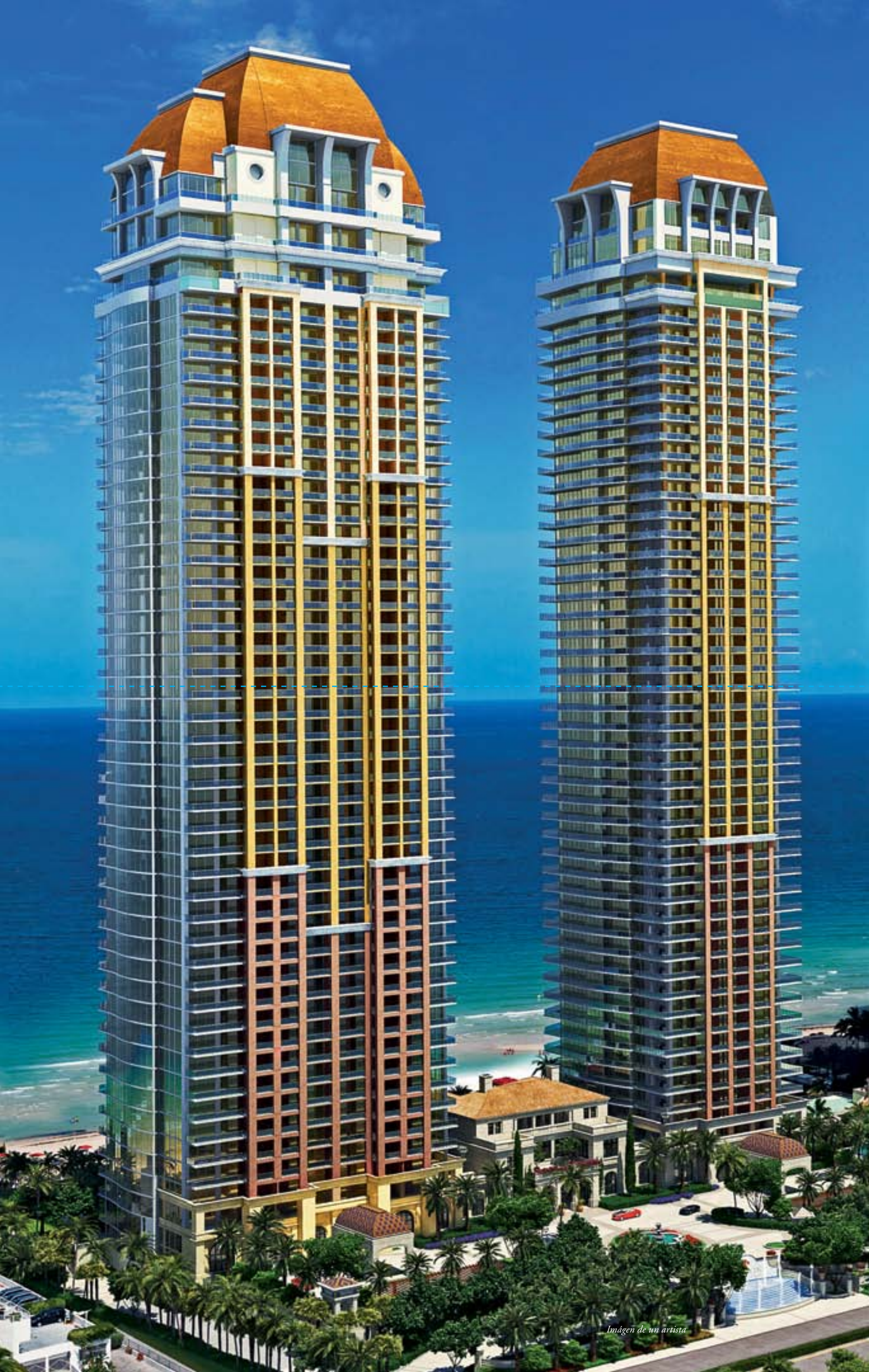
Imágen de un artista